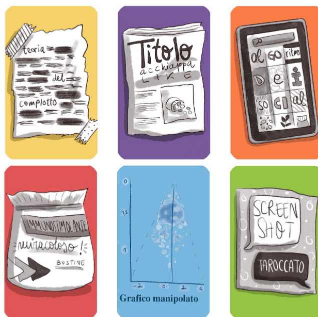
Figura 5. Gli strumenti di diffusione delle fake news

Con questa dinamica duale il gioco ha permesso di alternare momenti di indagine e confronto, mantenendo un equilibrio tra dimensione ludica e didattica.