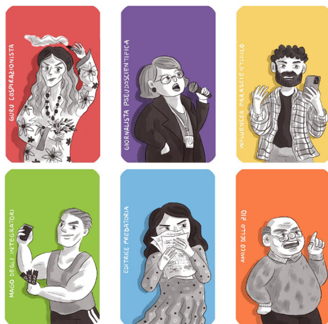
Figura 3. I personaggi del Detective Game della Scienza