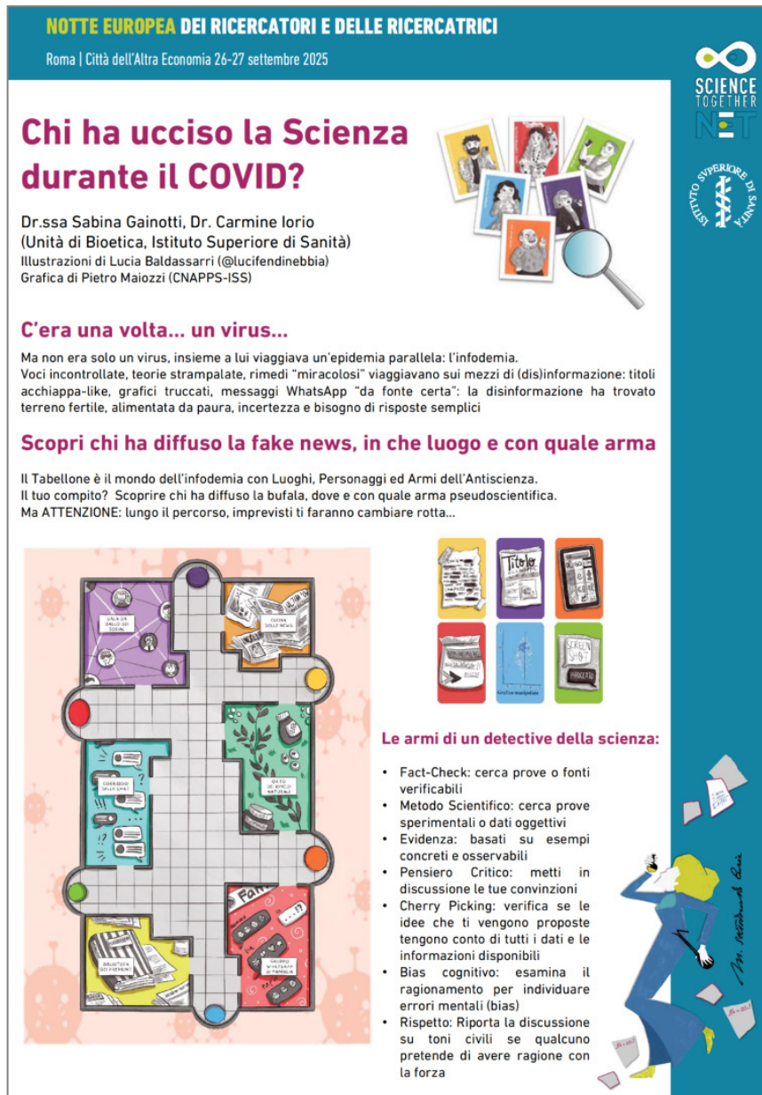
Figura 1. Poster per presentare il gioco Chi ha ucciso la Scienza durante il COVID-19?

fondono rende necessaria una riflessione sulla scienza e sul modo in cui essa può essere comunicata e, soprattutto, condivisa: in questo contesto si inseriscono il Detective Game della Scienza (Figura 1) e il presente contributo.