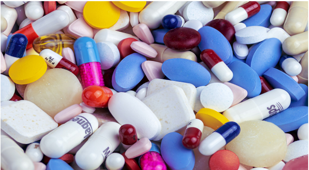
Figura 1. Esempi di farmaci

La “molecolarizzazione” 1 degli organismi viventi è stato il tratto saliente della spiegazione biologica del XX secolo. Non si vuole qui assumere che “la vita non è altro che chimica”, ma tale disciplina è il principale punto di riferimento per “leggere” il vivente, la prospettiva privilegiata in cui oggi viene interpretato il vivente [4]. La vita di un organismo, infatti, non si esaurisce nelle relazioni con l’interno (le sostanze chimiche costituenti) e con l’esterno (l’ambiente chimico) in cui esso vive, ma senza di essi non è facile studiarlo scientificamente. È questo il motivo per cui per “riparare” un organismo in farmacologia si ricorre a specifiche sostanze chimiche (principi attivi dei farmaci) e/o a cocktail di esse (Figura 1).